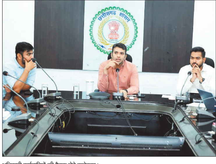
अधिकारी कर्मचारियों की बैठक लेते कलेक्टर।

कलेक्टर ने कहा कि जिले में संचालित उद्योगों में बड़ी संख्या में श्रमिक कार्यरत हैं। ऐसे में औद्योगिक इकाइयों में सुरक्षा मानकों का पालन सुनिश्चित किया जाना अत्यंत आवश्यक है। उन्होंने सभी एसडीएम को समस्त औद्योगिक इकाइयों की सतत जांच एवं निगरानी करने तथा साप्ताहिक रिपोर्ट प्रस्तुत करने के निर्देश दिए। साथ ही नेटवर्क विहीन क्षेत्रों की सूची उपलब्ध कराने को कहा गया, ताकि वहां मोबाइल टावर स्थापना की पहल की जा सके। कलेक्टर ने आयुष्मान कार्ड पंजीयन एवं पीवीसी कार्ड वितरण, नवीन आधार